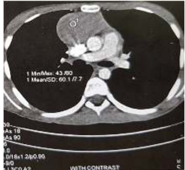
شکل ۱: سی تی اسکن ریه با کنتراست که نشان دهنده توده مدیاستن قدامی و میانی است (با اندازه ۸ در ۴/۳ سانتی متر)

با در نظر داشتن مرحله IIB بر اساس طبقه بندی Ann Arbor برای بیمار، پروتکل درمانی وینکریستین، اتوپوزاید، پردنیزون، دوکسوروبیسین (OEPA) + سیکلوفسفامید، وینکریستین، پروکاربازین، پردنیزون (COPP) انتخاب شد ۱۴ .