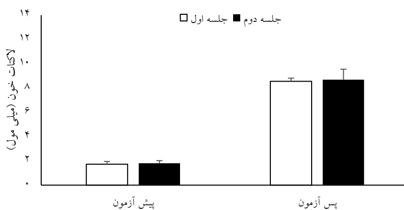
شکل ۳- مقایسه تغییرات لاکتات خون در طول پیش آزمون و پس آزمون در بین جلسات اول و دوم در گروه دارونما