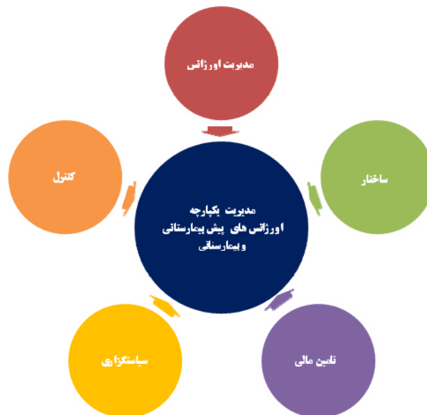
مدل پیشنهادی مدیریت یکپارچه اورژانس‌های پیش بیمارستانی و بیمارستانی با توجه به شرایط پژوهش

اورژانس احصا و عناصر موثر بر خدمات اورژانس شامل ورودی‌ها، فرایندها، خروجی‌ها و پیامدها در تعامل با مؤلفه‌های اورژانس در سطوح مختلف فراملی، ملی و محلی تعیین گردیدند. پژوهش نشان داد که علیرغم کمبود منابع مالی و انسانی در سیستم بهداشت و درمان ایران، به منظور تامین انتظارات بیماران نیازمند به مراقبت اورژانس، نیاز به اصلاح خدمات اورژانس می‌باشد و این اقدام نیازمند سازماندهی مجدد اورژانس‌های پیش بیمارستانی و ارتقای بخش اورژانس در داخل بیمارستان و بهره‌گیری از منابع بودجه مراقبت‌های سرپایی در اورژانس‌های پیش بیمارستانی برای پرداخت جهت مداوای سرپایی بیماران در خارج از بخش اورژانس بیمارستانی با بکارگیری رویکردهایی موثر بر بهبود مکانیزم فعالیت و پرداخت در اورژانس‌های پیش بیمارستانی و بیمارستانی در کشور ایران می‌باشد. لازم است دولت پشتیبانی‌های لازم را از بخش‌های اورژانس به عمل آورد تا هدف دسترسی میسر گردد. از سوی دیگر؛ برنامه ریزی برای زیرساخت‌های اورژانس را باید در قالب طرح‌های توسعه عمومی اورژانس انجام داد. در پایان ذکر این نکته ضروری است که امروزه با وجود